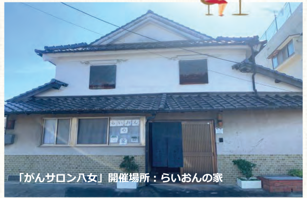
「がんサロン八女」開催場所：らいおんの家

八女の趣きある古民家「らいおんの家」でほっとできる時間を一緒に過ごしてみませんか？