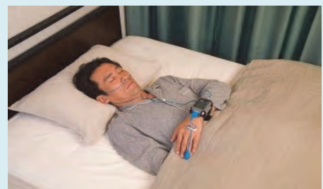
簡易スクリーニング検査

まずはお近くの 耳鼻咽喉科 にご相談ください。 精密検査が必要になった場合は当院で受付が可能です。